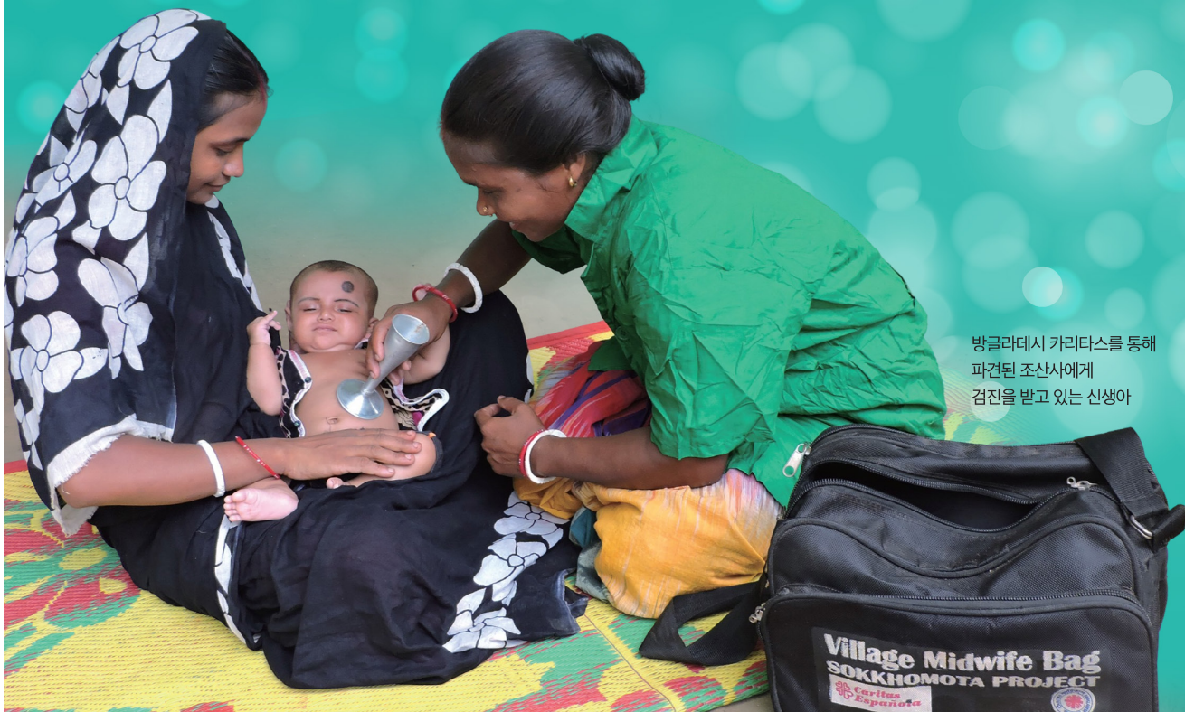
방글라데시 카리타스를 통해 파견된 조산사에게 검진을 받고 있는 산생아

헌미헌금 봉헌의 달 캠페인을 통해 방글라데시, 캄보디아의 아동과 임산부를 포함한 취약계층 약 6,500명에게 영양식과 의료 활동 및 의약품을 지원해주세요