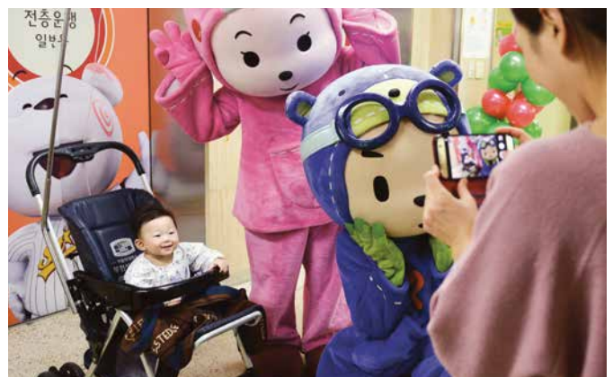
부천성모병원 어린이병동에서 캐릭터 탈을 쓴 인형과 기념촬영을 하는 환아와 엄마