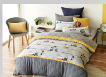
침구세트 (ss사이즈 이불, 베게,패드)