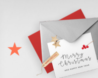
응원메시지가 담긴 성탄카드

(선물 1세트는 10만원 상당이며, 작은 정성이라도 함께 해주시면 큰 힘이 됩니다)