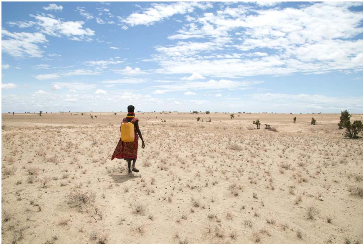
2017. 남수단 가뭄