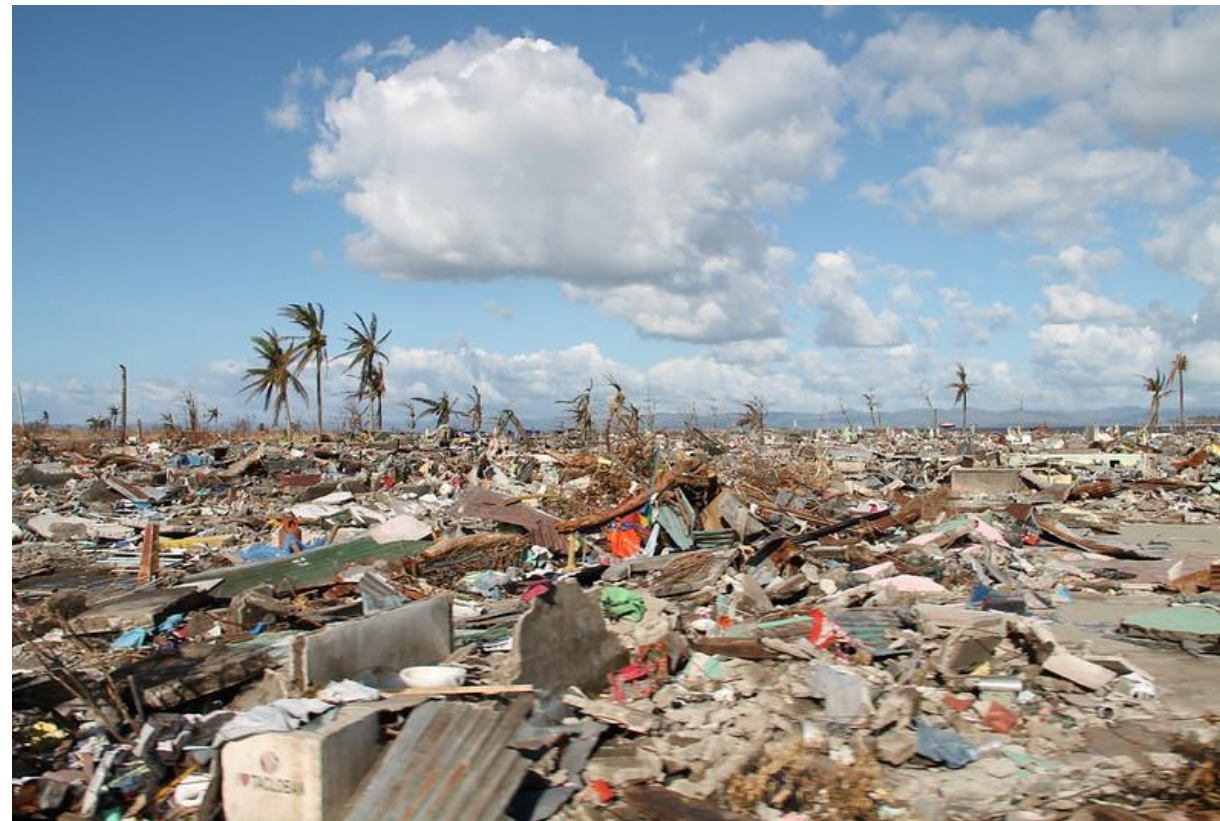
2013. 필리핀 태풍