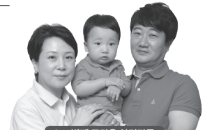
977번째 조가온 아기가족

생애첫기부는 사랑스럽고 소중한 아이의 기념일에 잔치를 열어주는 대신 그 비용을 고스란히 아프리카·아시아의 빈곤한 친구들과 국내의 백혈병·난치병으로 고통받고 있는 또래 친구들에게 전달하는 행복한 나눔입니다.