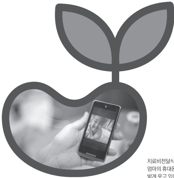
치료비전달식에 온 엄마의 휴대폰 속에서 밝게 웃고 있는 주원이

주원이(가명, 만 7세)는 2008년 백혈병 진단을 받았습니다. 고통스러운 치료를 잘 이겨내고 항암치료를 받으며 잘 생활하던 중 2013년 1월 병이 재발하였습니다. 유전자형이 일치하는 건강한 다른 사람에게서 조혈모세포를 이식받는 것 외에는 다른 치료수단이 없었습니다. 하지만 타인간 유전자형이 일치할 확률은 수만분의 1로 기증자를 찾기가 매우 어려워서 매년 1,200여명의 사람들이 기증자를 찾지못해 이식을 기다리다가 사망하게 되는데, 주원이에게는 지난 5월 기적이 일어났습니다. 해외에서 유전자가 맞는 기증자를 찾은 것입니다.