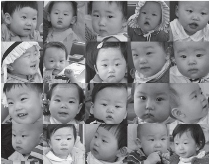
▲ ‘생애첫기부’에 함께 한 아기 기부천사들의 모습