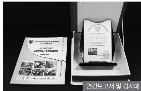
연간보고서 및 감사패