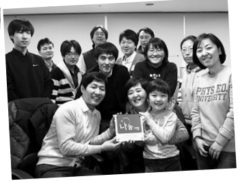
▲ (주)무원NB건축사사무소_10호점 ◀ 레인보우통신_14호점