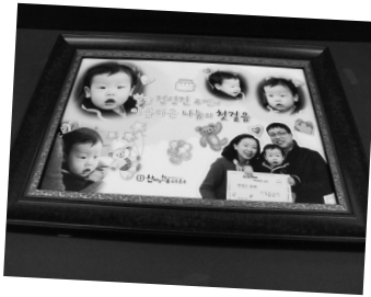
이미지넷_5호점 ▲ 참사랑성물_8호점 ▶