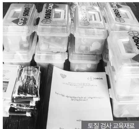
토질 검사 교육자료