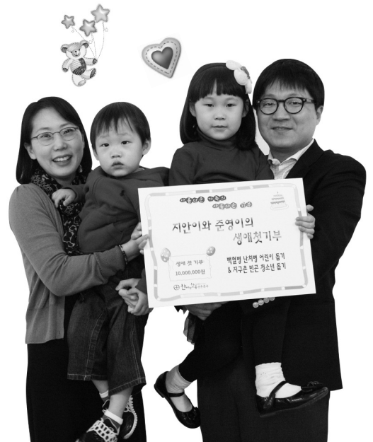
▲ 400번째 생애 첫 기부 가족이 지난 4/14(토), 서울 명동 가톨릭회관 4층 한마음한몸운동본부 사무국을 찾아 전달식을 가졌습니다.