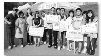
조혈모세포 기증 희망자 모집 캠페인