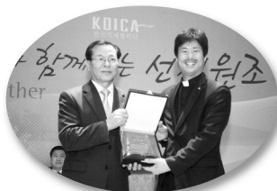
KOICA 감사패 수상