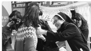
희망의 씨앗심기 캠페인