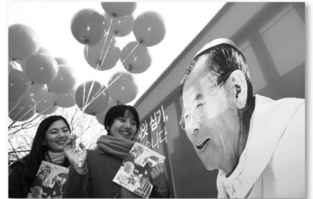
희망, 행복의 씨앗을 심는 2011년