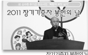
장기기증자 봉헌의 날