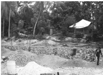
▲ 건축 중인 La Bruyere학교의 공사현장으로 올해 8월말 완공예정이다.

지난 2010년 1월 12일, 수십만 명의 사망자와 수백만 명의 이재민을 남긴 대지진 이후 아이티 곳곳에서는 현재 재건과 재활을 위한 다양한 활동들이 이루어지고 있습니다. 한마음한몸운동본부도 아이티 중장기 재건 및 재활을 위해 현지 협력단체인 아이티 카리타스 · 포르투프랑스 카리타스와 함께 총