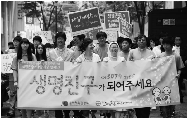
▲ 한마음한몸운동본부가 진행한 '자살예방 명동거리 캠페인'에서 참가자들이 자살예방에 대한 구호를 외치며 명동성당 들머리에서 명동 평화의 거리까지 행진에 나서고 있다.

청소년들이 직접 자살예방활동 전개 엽서 보내기·OX 퀴즈 등 다채로운 행사 펼쳐