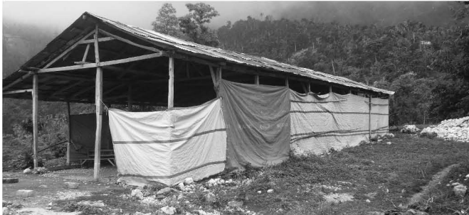
▲ 아이티 Petit-Goave 지역의 La Bruyere학교 학생들이 임시로 쓰고있는 천막교실

지난 5/24(화)~6/6(월), 2주간 본부 국제협력부 김대민 차장과 박재출 간사가 아이티를 다녀왔습니다. 이번 방문은 지진피해 이후 아이티의 장기적인 재건을 위해 본부가 지원하고 있는 학교 건축사업을 살펴보고 추가 지원을 위한 방법을 모색하기 위한 것이었습니다. 현지조사를 다녀온 박재출 간사가 아이티의 2011년 7월 현재 상황을 전해드립니다.