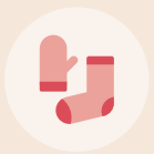
장갑, 등산양말 (2족) 2중세트