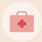
구급약 키트 (밴드, 파스, 상비약)