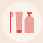
세면도구세트 (치약, 칫솔, 타월, 샴푸, 린스, 면봉, 면도기 등)