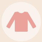
속옷 1세트 (기능성 발열내의)