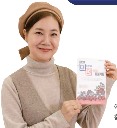
한마음한몸운동본부 홍보대사 탤런트 양미경